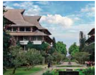
バンドン工科大学 生徒数:約20,000人