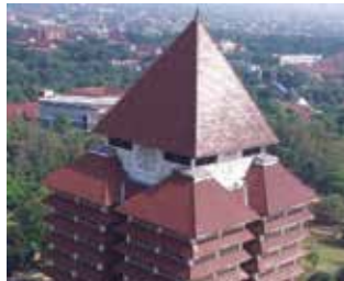
インドネシア大学 生徒数:約50,000人