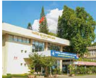
ホーチミン工科大学 生徒数:約30,000人